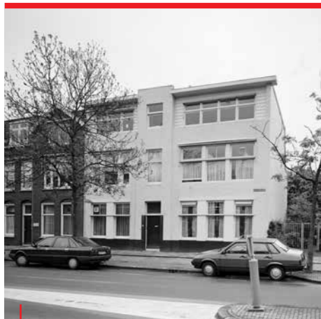
2 HUIS VAN DER VUURST DE VRIES 1927

In 1927 vroeg de nieuwe eigenaar Rietveld het huis te verbouwen. De opvallendste vernieuwing was aan de buitenkant. De woning had een traditioneel uiterlijk, vergelijkbaar met de huizen links. De zolder met het schuine dak werd uitgebouwd tot een volwaardige verdieping. Het huis kreeg een plat dak, dat in die tijd heel vernieuwend was. Er kwamen nieuwe, bredere ramen en de gevel werd één geheel door de ruwe pleisterlaag. Die werd grijs, een kleur die Rietveld graag gebruikte.