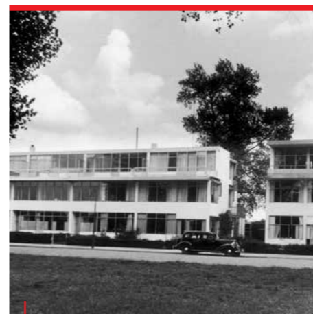
5 WONINGEN ERASMUSLAAN 1931, 1934

In 1924 ontwierp Rietveld voor Truus Schröder zijn eerste huis. Zij wilde na de dood van haar man met haar kinderen in een nieuw huis opnieuw beginnen. Net als in haar oude huis wilde ze niet op de begane grond, maar boven wonen. Op de verdieping richtte Rietveld een open leefruimte in, die met schuifwanden ook in aparte kamers kan worden ingedeeld. De buitenkant werd dusdanig opvallend dat het huis wereldberoemd werd. Het huis lijkt opgebouwd uit horizontaal en verticaal naast elkaar geplaatste losse vlakken. Ze zijn in verschillende tinten wit en grijs geschilderd. De ramen zijn zwart, zodat ze optisch wegvallen. Enkele dragende elementen zijn donkerblauw, rood of geel geverfd, en geven zo horizontale en verticale accenten. Het uitzicht op de toen nog onbebouwde polder vormde een belangrijk onderdeel van het ontwerp. De ramen aan de noordoostkant van de verdieping keken erop uit. De grote raampartij aan die kant heeft geen raamstijl. Als de ramen open staan, verdwijnt de hoek en lijkt het alsof je tegelijkertijd binnen én buiten bent. Toen begin jaren zestig het viaduct werd gebouwd, vond Rietveld zijn ontwerp dusdanig aangetast dat hij voorstelde het huis te slopen. Truus Schröder wilde echter graag in het huis blijven wonen. Na haar dood werd het huis een museumwoning waarin bezoekers de ideeën van Rietveld en Schröder kunnen ervaren.