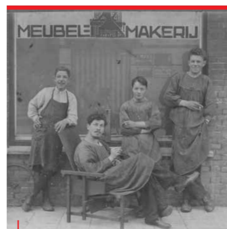
6 MEUBELWERKPLAATS RIETVELD GERRIT RIETVELD IN STOEL

Toen het bouwverbod op de polder tegenover het Rietveld Schröderhuis werd opgeheven, kocht Truus Schröder de grond ertegenover. Zo kon zij haar nieuwe uitzicht zelf bepalen. Rietveld ontwierp daarvoor een rij met vier huizen (1931) en een blok met zes appartementen (1934) in de stijl van Het Nieuwe Bouwen. Het ontwerp voorzag in ruime lichtinval en optimaal contact met de buitenlucht. Daarom hebben de huizen brede doorlopende raamstroken, balkons op de verdiepingen en heeft elke kamer een deur naar buiten. In oktober 1931 werd één van de woningen opengesteld om een modelinterieur van Rietveld te tonen. Dat is nu zichtbaar in de modelwoning. Opvallend is het kleurgebruik. De bakstenen gevels zijn wit gepleisterd. Binnen gebruikte Rietveld pastelkleuren. Daarvoor bleef hij ook in de latere interieurs die hij ontwierp voorkeur houden.