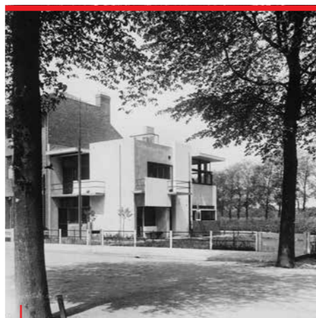
4 RIETVELD SCHRÖDERHUIS 1925

Al in de jaren twintig ontwikkelde Rietveld ideeën voor grootschalige sociale woningbouw. Pas in de jaren vijftig kreeg hij in Utrecht de kans die te realiseren. Rietveld vond het belangrijk dat de huizen er van buiten hetzelfde uitzagen. Daarom hebben ze dezelfde raamindeling met bovenlichten van geribbeld matglas en onderkanten van draadglas met daarachter panelen in verschillende kleuren. De betonnen vloeren steken uit in de gevel. Ze zijn gekarteld, zodat regenwater geen strepen achterlaat op de muren. De flats hebben betonnen lamellen. Die stonden vroeger open, zodat de was in de ruimte erachter goed kon drogen, maar niet in het zicht stond. Op Robijnhof 13 is een museumwoning ingericht, die een indruk geeft van hoe men hier in de jaren vijftig woonde.