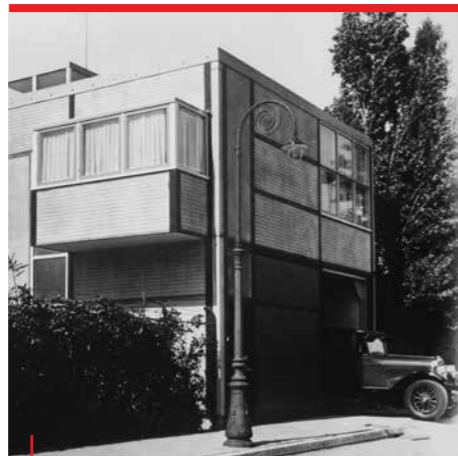
3 CHAUFFEURSWONING 1927 Rietveld Schröder Archief

In 1927 vroeg de nieuwe eigenaar Rietveld het huis te verbouwen. De opvallendste vernieuwing was aan de buitenkant. De woning had een traditioneel uiterlijk, vergelijkbaar met de huizen links. De zolder met het schuine dak werd uitgebouwd tot een volwaardige verdieping. Het huis kreeg een plat dak, dat in die tijd heel vernieuwend was. Er kwamen nieuwe, bredere ramen en de gevel werd één geheel door de ruwe pleisterlaag. Die werd grijs, een kleur die Rietveld graag gebruikte.